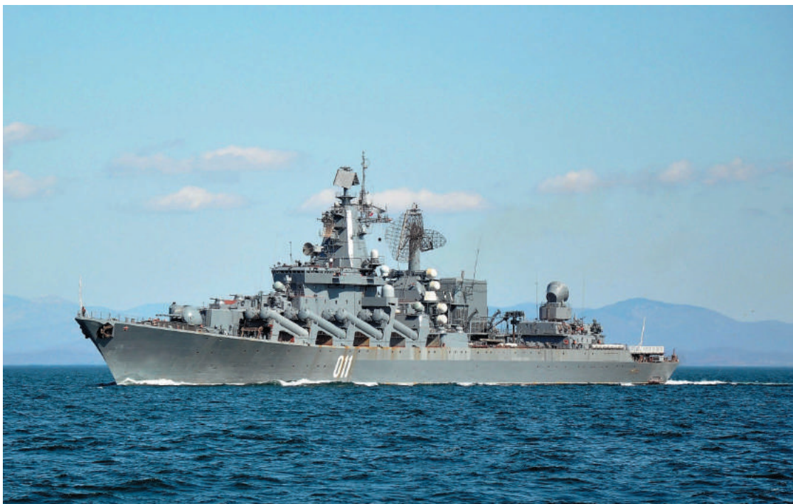
Гвардейский ракетный крейсер «Варяг»

9 ноября 2010 года корабль прибыл с неофициальным визитом в южнокорейский порт Инчхон. На него была возложена историческая мис-