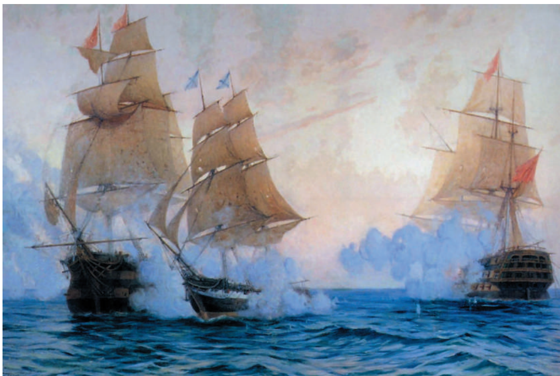
Брик «Меркурий». Большой подвиг маленького корабля

водец. Он участвовал 8 октября 1827 г. в знаменитом Наваринском сражении объединенного флота России, Англии и Франции против турецко-египетского флота. Сражаясь одновременно с пятью турецкими кораблями, «Азов», уничтожил четыре, а пятый, 80-пушечный линейный корабль под флагом командующего неприятельским флотом, заставил выброситься на мель. В этом бою особенно отличились офицеры «Азова» лейтенант П.С. Нахимов, мичман В.А. Корнилов и гардемарин В.И. Истомина. Из 600 человек экипажа «Азова» 153 были убиты и ранены. В корпусе «Азова» насчитали потом 153 пробоины, в том числе семь подводных. Но героический линейный корабль не